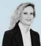
Gabrielle HALPERN Philosophe

A partir d'une présentation du concept d'hybridation par la philosophe Gabrielle Halpern, nous débattons avec les parties prenantes de l'écosystème Adefpat : en quoi la méthode Adefpat est-elle hybride ? En quoi cette hybridation participe-t-elle à la pérennisation des projets accompagnés ? Les projets eux-mêmes sont-ils de plus en plus hybrides ? Faut-il renforcer l'hybridation au regard des nouveaux enjeux ? Et si oui, comment ?