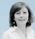
Carole DELGA Ancienne Ministre, Présidente de la Région Occitanie/Pyrénées-Méditerranée